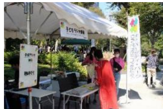
子どもラジオ体験