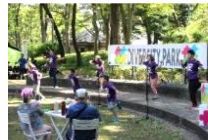
劇団☆ゆにい〜く&ぴい〜す