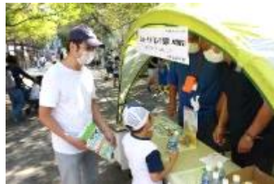
スポーツドリンク提供