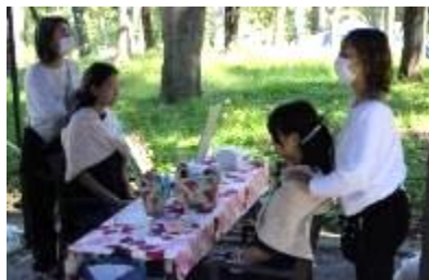
イヤビューティ施術体験