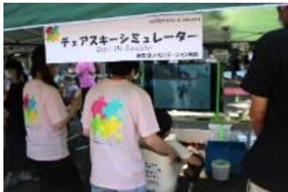
チェアスキーシミュレーター