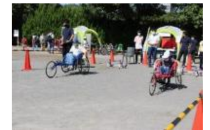
レーサー(競技用車いす)