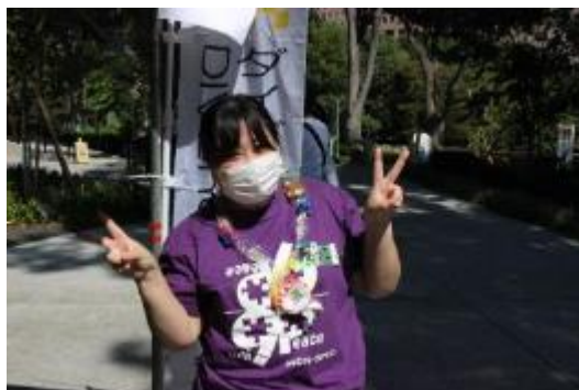
キャンディレイ作り