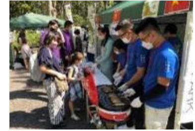
日建総業(ネムレイ)