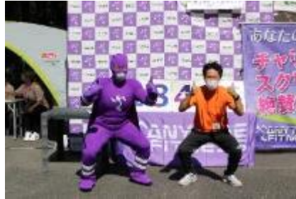
チャリティースクワット