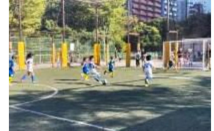
ダイバーシティカップ