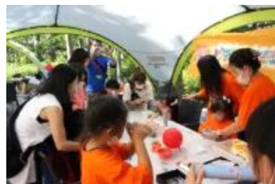
世界に一つの万華鏡