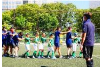
ブラインドサッカー体験