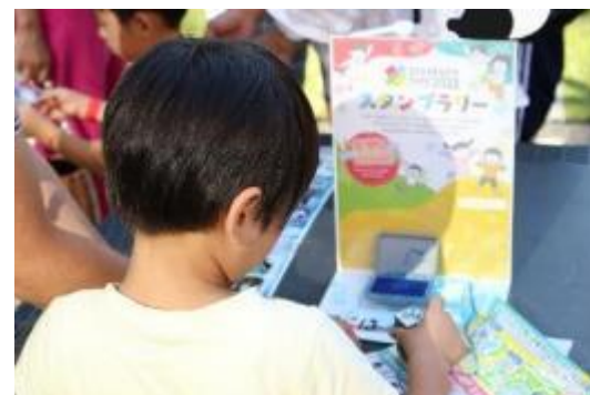
スタンプラリーステーション