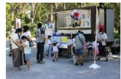
a luckyfood company