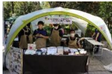
オリジナル缶バッジ