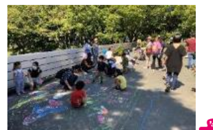
大らかがき&ぬりえ