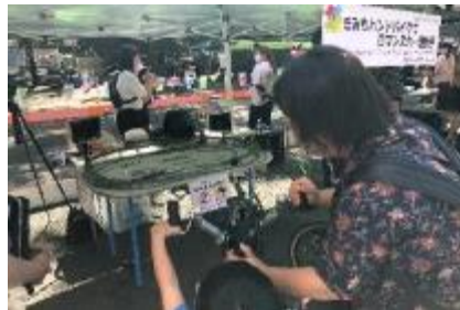
ハンドバイクでロマンスカー運転士