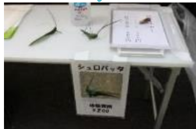
国際交流日本文化体験