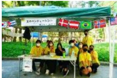
スカベンジャーハント