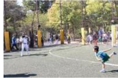
キャッチボール体験