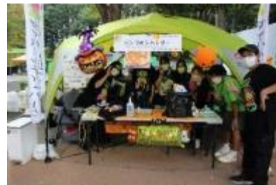
パンプキンハンター