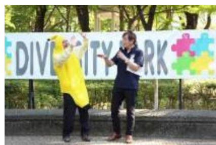
ばなな先生・ヤセ騎士