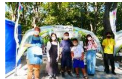
誰でもモノづくり体験