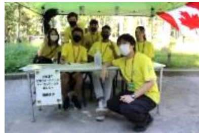
世界のボードゲーム