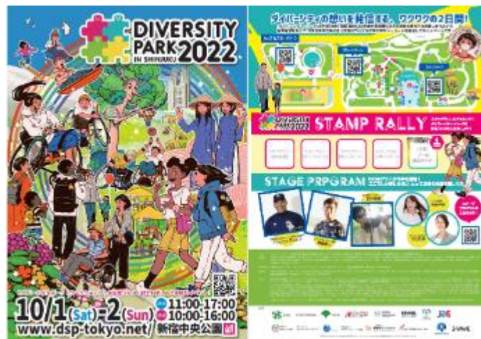
プログラム・ポスター