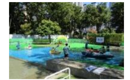
ユニバーサルカヌー