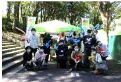
スタンプラリー景品交換所