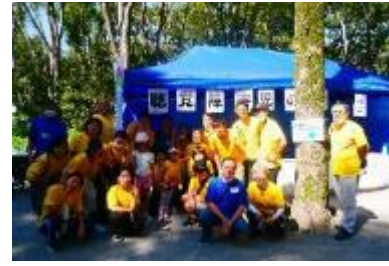
大塚クラブ(マドレーヌ)