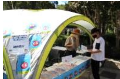
読書を楽しむコーナー