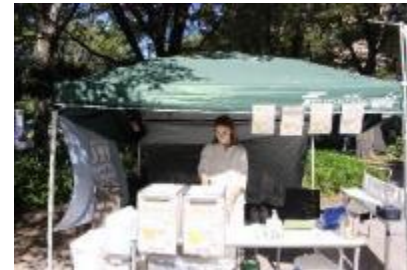
Y.Y.G BREWING COMPANY