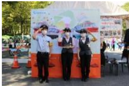
なりきり駅長撮影会